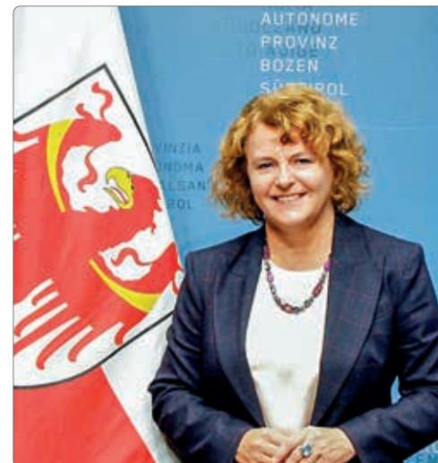
Rosmarie Pamer Landesrätin für Sozialen Zusammenhalt, Familie und Ehrenamt; Landeshauptmannstellvertreterin

Erhöhung des Landeskindergeldes stärkt soziale Gerechtigkeit