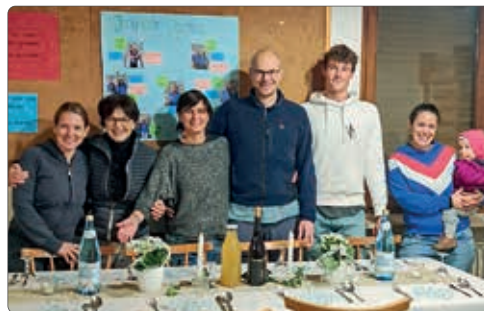
die fleißigen Tischdecker