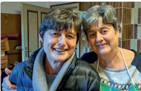
Die beiden fleißigen Köchinnen

„Ein rundum gelungener Abend, der uns alle noch lange in bester Erinnerung bleiben wird“, lautete das einhellige Fazit sowohl des Pfarrgemeinderats als auch der teilnehmenden Paare. Ein herzliches Dankeschön gilt allen, die mit ihrem Einsatz, ihrer Zeit und ihrem Engagement zum Gelingen dieser besonderen Feier beigetragen haben.