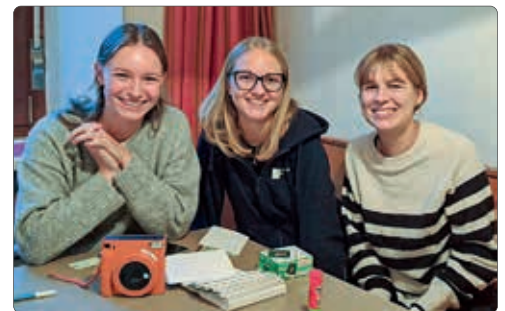
die fleißigen Jungscharleiterinnen, die ein nettes Präsent für die Paare gebastelt haben

31 Paare feierten gemeinsam ihr rundes oder halbrundes Ehejubiläum