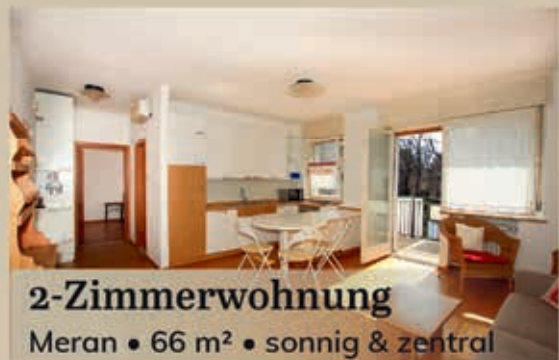
2-Zimmerwohnung Meran • 66 m 2 • sonnig & zentral