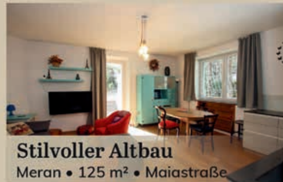
Stilvoller Altbau Meran • 125 m 2 • Maiastraße