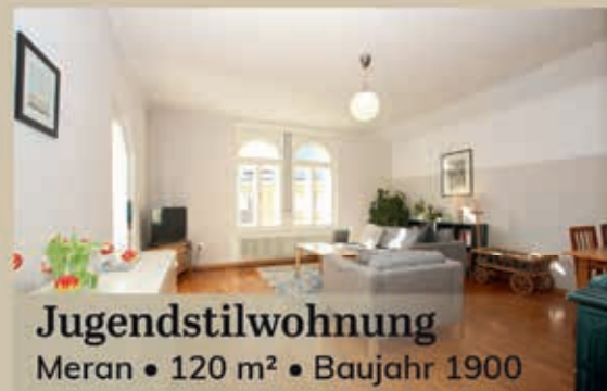
Jugendstilwohnung Meran • 120 m 2 • Baujahr 1900